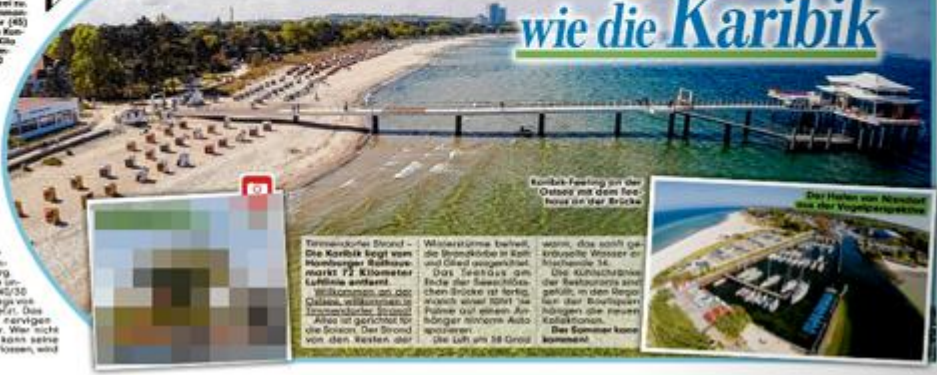
Kombi-Festung an der Ostseite mit dem Beachhaus in der Brücke