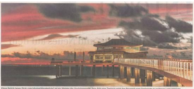
Klara Kahlitz (www.tlickr.com/photos/klara) ist ein Meister der Nachtaufnahme. Sein Bild vom Teehaus zeigt das Bauwerk samt Seebäder in goldenes Licht gefasst.

Das Sommer kann kommen. Die Strandkörbe sind im Strandkörbehaus zu finden. Die Strandkörbe sind im Strandkörbehaus zu finden.