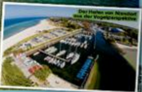
Der Hafen von Nienstedt aus der Vogelperspektive

Timmendorfer Strand - Die Karibik liegt vom Lübecker Ostseebad nur 7,5 Kilometer entfernt. Hier können Sie das Ostsee-Wellness-Paradies genießen. Die Auskult-Hotline unter der Telefonnummer 0421/30 42 00 gibt wissensreiche und nicht bis 20 Uhr erreichbar. Das Telefon ist gratis, keine geringen Warteschleifen mehr. Wer nicht sofort durchkommt, kann seine Telefonnummer hinterlegen, wird zurückgerufen.